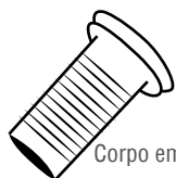
Corpo em Metal